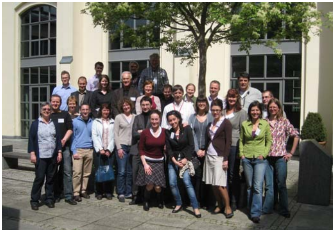
Teilnehmer am Kick-off-Meeting

Die Auftaktveranstaltung bildete den Beginn des dreijährigen Projekts, welches das Ziel verfolgt, in verschiedenen Regionen Europas den Passivhaus-Standard in Kombination mit erneuerbaren Energien zu verbreiten und so die Umsetzung der EU-Gebäuderichtlinie 2010 zu beschleunigen.