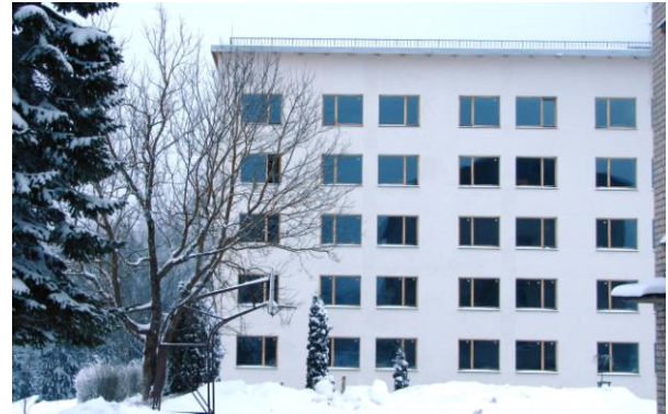
Ergli Vocational Secondary School

e alla formazione dell'intera regione di Ergli. Info sul progetto