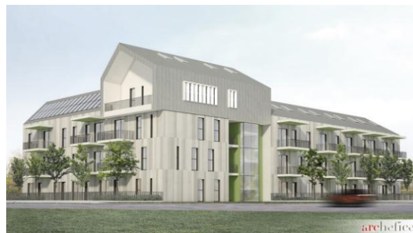
Social Housing Case Finali / studio associato Archefica

vicinanze di una collina. Il progetto di Case Finali è un edificio di diversi piani con 25 appartamenti. Progettato dallo studio di architettura Archefica, l'edificio è caratterizzato da una rivisitazione della tipologia a ballatoio con gli accessi agli appartamenti da un lungo semi-privato balcone. Info sul progetto