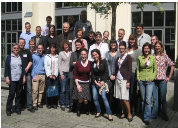
Partecipanti al Kick-off Meeting di PassREg; foto: Passive House Institute

Il ruolo primario che Francoforte riveste nell'edilizia ad alta efficienza energetica è chiaro: con una politica efficace sono stati finora costruiti, seguendo gli standard Passive House, più di 1600 appartamenti, oltre a numerose scuole, asili e altri edifici non residenziali. Diversi viaggi-studio hanno offerto ai partecipanti l'occasione di visitare, sia a Francoforte che ad Heidelberg, edifici completati o in fase di costruzione e progetti di ristrutturazione. Ad Heidelberg, ulteriore regione all'avanguardia coinvolta nel progetto appena a 100 km più a sud di Francoforte, è in fase di costruzione un intero quartiere di 116 ettari completamente conforme allo standard Passive House.